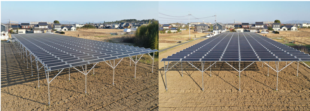
【写真② 現在の営農型太陽光発電設備の状況 (2025年10月時点)】